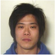
サービス提供責任者