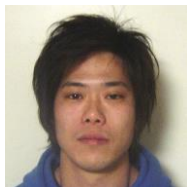
サービス提供責任者